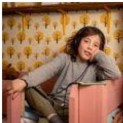
478 KB jpg bruin luistert.jpg