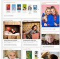
112 KB jpg printscreen nieuwe website Jeugdbibliotheek.JPG

al geleende e-books per leeftijdscategorie