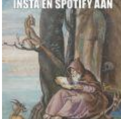
1.2 MB png Voorbeeldmeme 2.png