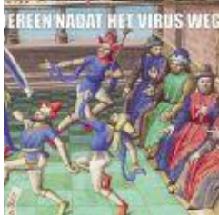
2.4 MB png Voorbeeldmeme 3.png