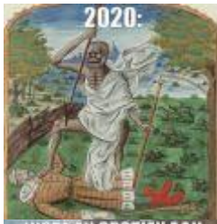
1.8 MB png Voorbeeldmeme 1.png