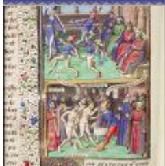
2.8 MB jpg Voorbeeldhandschrift -Dance of Fools.JPG