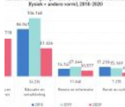
16 KB png Aantal activiteiten georganiseerd door bibliotheken 2018-2020 fysiek en anders.png